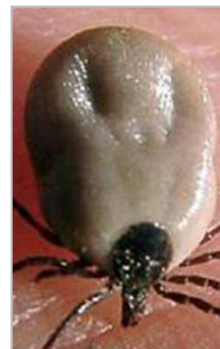
La tique s'agrippe à sa proie et se nourrit de sang.

■ Pour obtenir plus de renseignements, contacter l'association de lutte contre les maladies vectorielles à tique : contact@francelyme.fr ou au www.francelyme.fr