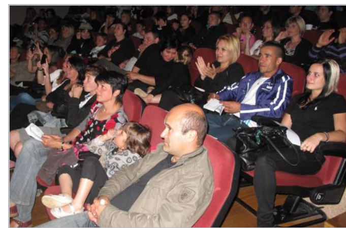
Le public a salué avec enthousiasme la prestation des artistes qui ont défilé vendredi soir au centre culturel.