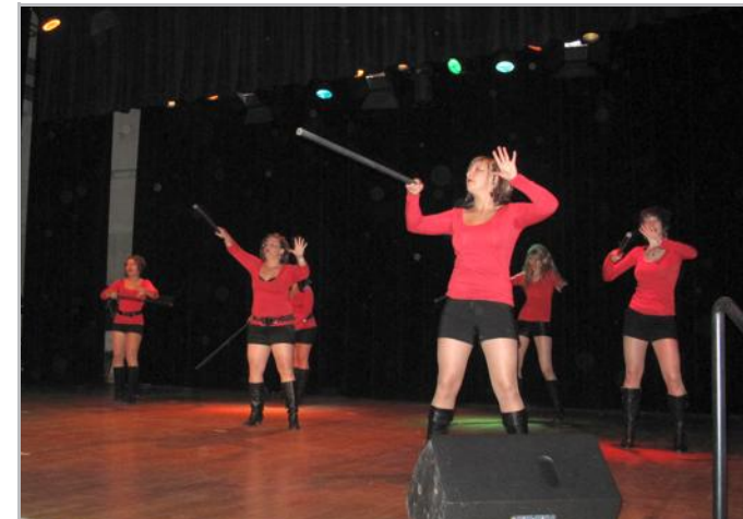
Des performances dansées ont tenu en haleine les spectateurs qui ont eu droit à une soirée de qualité.